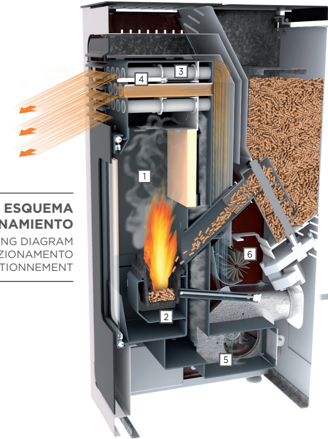
ESQUEMA DE FUNCIONAMIENTO OPERATING DIAGRAM SCHEMA DI FUNZIONAMENTO SCHÉMA DE FONCTIONNEMENT